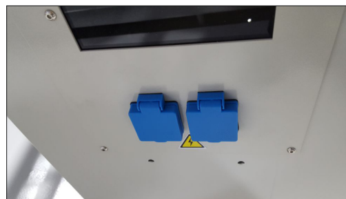
Box mit Frequenzumrichter und 2 Steckdosen

CE-conform durch Sicherheitsschalter Lackierung RAL 9002 und RAL 7016 Gesamtlänge 1.930 mm Breite: 600 mm Gewicht 240 kg Standmodell Technische Änderungen vorbehalten